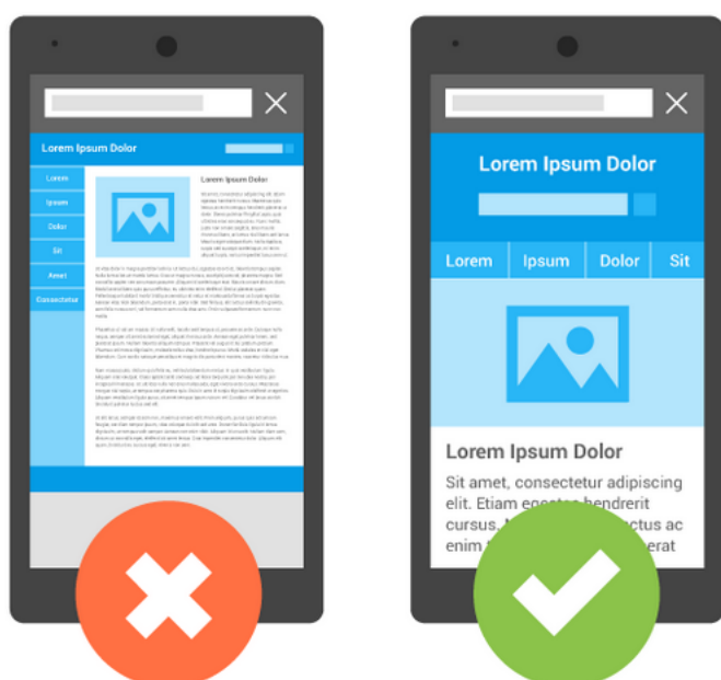
(左) 傳統網站頁面不變直接縮小，不易瀏覽。 (右) 多螢幕網站根據瀏覽者載具大小自動切換成適合頁面，易於瀏覽。

除了瀏覽障礙外，程式執行也會有問題，因為平板和智慧型手機的效能並不如電腦強大，所以在瀏覽電腦版網站時，速度會變慢且更可能會造成當機情況，這都是目前面臨問題。